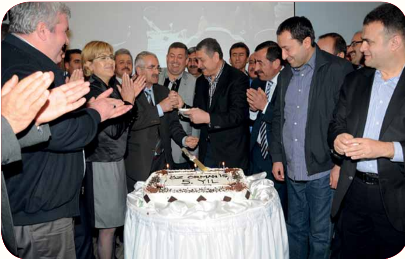
Hak-İş İl Temsilcileri Toplantısında Öz Orman-İş'in 5. kuruluş yıldönümü de kutlandı.

İki gün süren Hak-İş İl Temsilcileri Toplantısının ardından bir de sonuç bildirgesi yayınlandı. Bildirgede; Toplu İş İlişkileri Kanun Tasarısının bir an önce yasalaştırılması, böylelikle, çalışanların toplu sözleşmesiz kalma kaygısının ortadan kaldırılması, kayıtdışılığın önlenmesi, sendikal örgütlenme önündeki engellerin kaldırılması, çalışanlara karşı yapılan haksız saldırıların son bulması, İş Sağlığı ve Güvenliği Kanunu'nun acilen çıkarılarak iş cinayetlerinin önüne geçilmesi başta olmak üzere, çalışanların beklentilerine vurgu yapıldı.