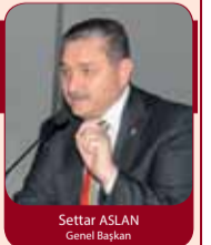
Settar ASLAN Genel Başkan

Öz Orman-İş olarak, hiç bir şekilde sorumlusu olmadığımız 'yevmiye tespiti' sorununu, üyelerimizin mağduriyetine yol açmadan çözebilmek için her türlü çabayı göstermekte olduğumuzu belirtmek isterim.